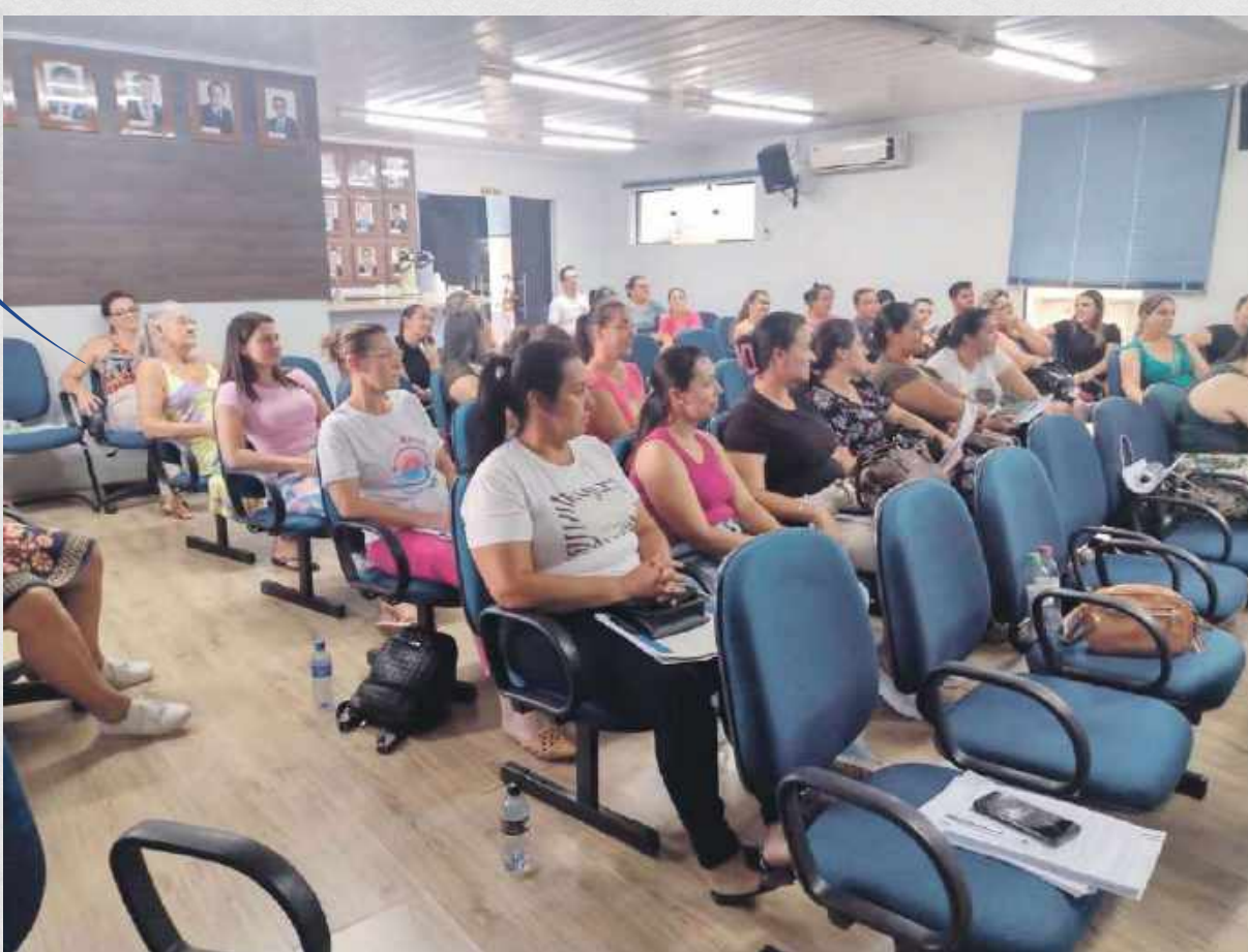
Capacitação para conselheiros tutelares