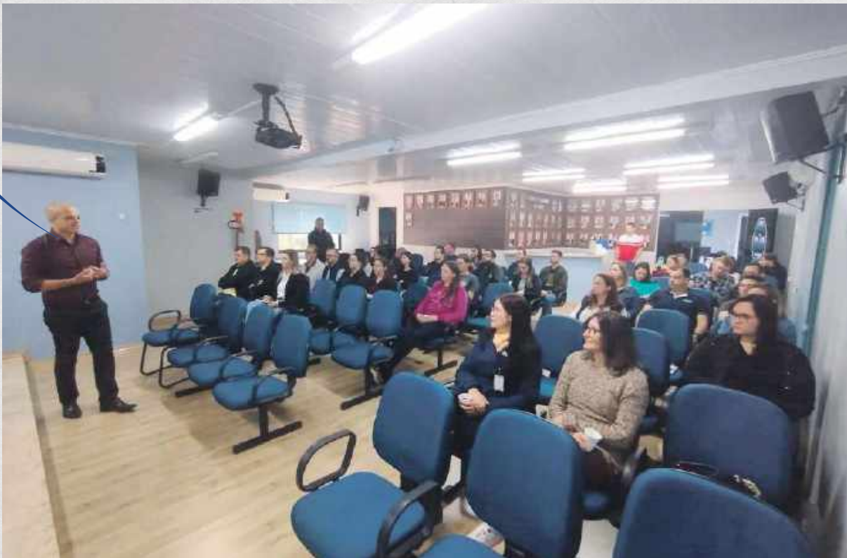
Curso aspectos jurídicos e práticos do licenciamento ambiental municipal