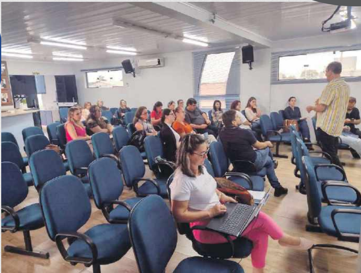
Capacitação da Operacionalização da Lei Paulo Gustavo nos Municípios