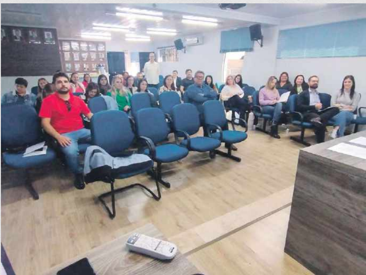
Oficina prática de todas as fases para inclusão do Município para receber os benefícios da Lei Aldir Blanc