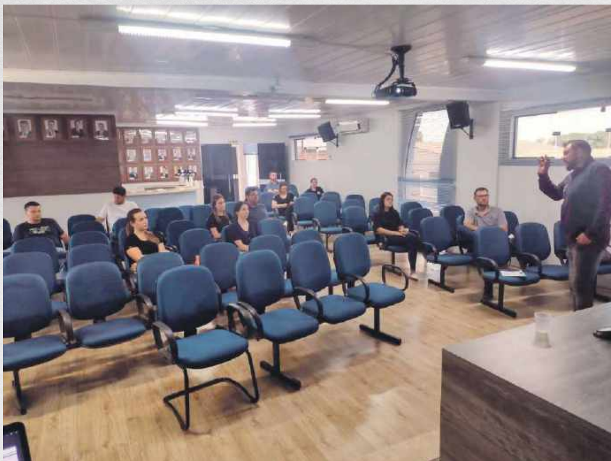
Capacitação de Operacionalização do sistema Sinaflor – Operação do sistema DOF e Rastreabilidade