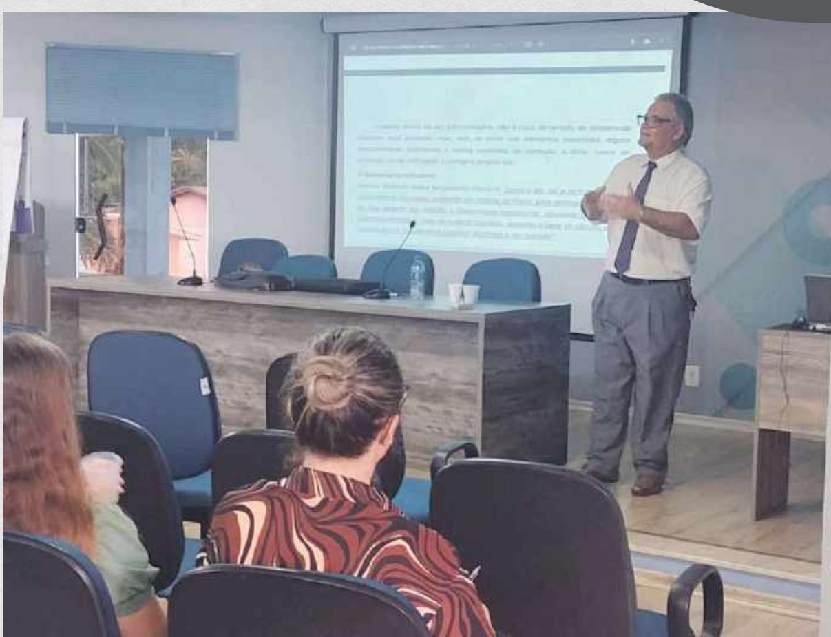
Capacitação sobre o ISS na prática: fiscalização, retenção, processos administrativos fiscais – Nota Fiscal de Serviço Eletrônica