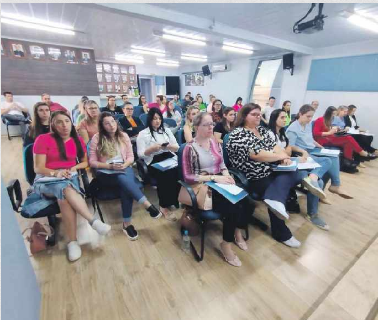
Capacitação sobre o Peate aos servidores municipais