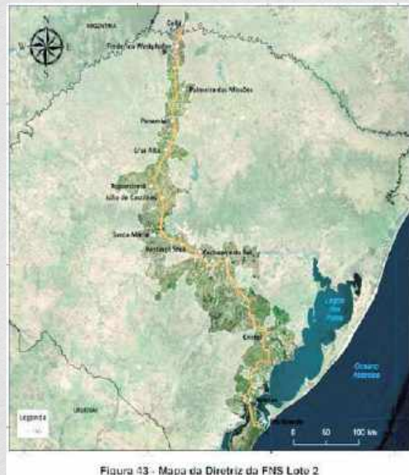
Figura 13 - Mapa da Diretriz da FNS Lote 2