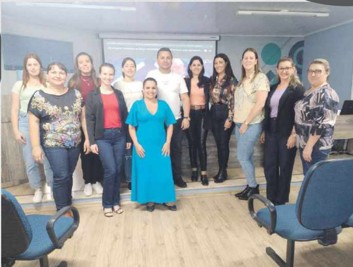
Capacitação Fundo Criança e Adolescente e Fundo do Idoso